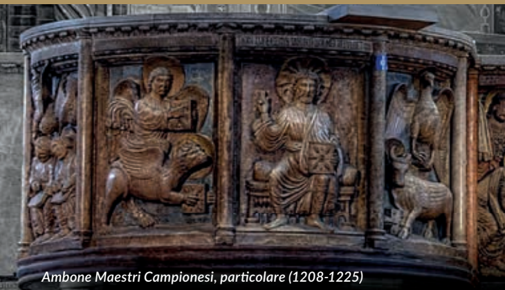
Ambone Maestri Campionesi, particolare (1208-1225)