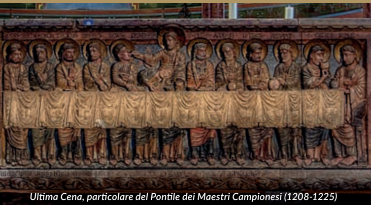
Ultima Cena, particolare del Pontile dei Maestri Campionesi (1208-1225)